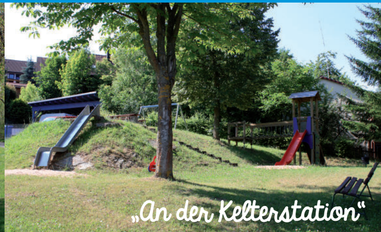
„An der Kelterstation“

Ein Sitzplatz aus Sandstein und eine Bank laden zum Verweilen und Picknicken ein.