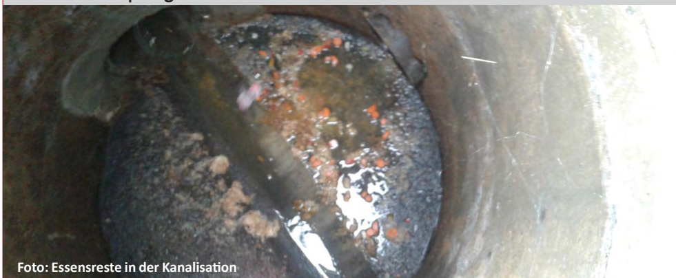
Foto: Essensreste in der Kanalisation

Immer wieder erhalten wir Anrufe von besorgten Bürgern, die sich über Ratten in ihrem Garten oder Anwesen beschwerten. Ratten haben im Garten nichts zu suchen – aber leider häufig eine Menge zu finden! Häufige Ursachen sind fehlerhafte Kompostierung und unsaubere Kleintierhaltung, die die Nager anlocken. Auch durch den Abfluss entsorgte Fette und Essensreste sind für Ratten „ein gefundenes Fressen“.