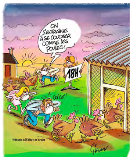
Übersetzung: „Wir trainieren wie die Hühner ins Bett zu gehen“ (um 18.00).

Die Situation in unserer Partnergemeinde bezüglich Covid-19 gestaltet sich ähnlich schwierig wie bei uns. Seit dem 16. Januar gibt es eine landesweite Ausgangssperre zwischen 18:00 Uhr abends und 6:00 Uhr morgens. Ohne eine Ausnahmegenehmigung darf in dieser Zeit niemand unterwegs sein. Bei Zuwiderhandlung beträgt die Geldstrafe zwischen 135€ und 3.750€. Außerdem steht ein dritter Lockdown kurz bevor.