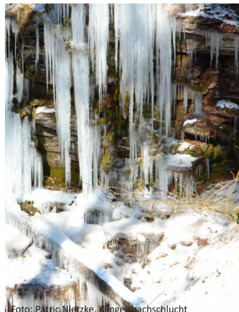
Klingelbachschlucht

Radweg neben St.2299 Richtung Homburg nach Verladestation HC; St.2299 Campingplatz Main Spessart, Richtung Marktheidenfeld; Schleusenweg Trennfeld; Bahndamm Bahnhofstraße ab MSP 36.